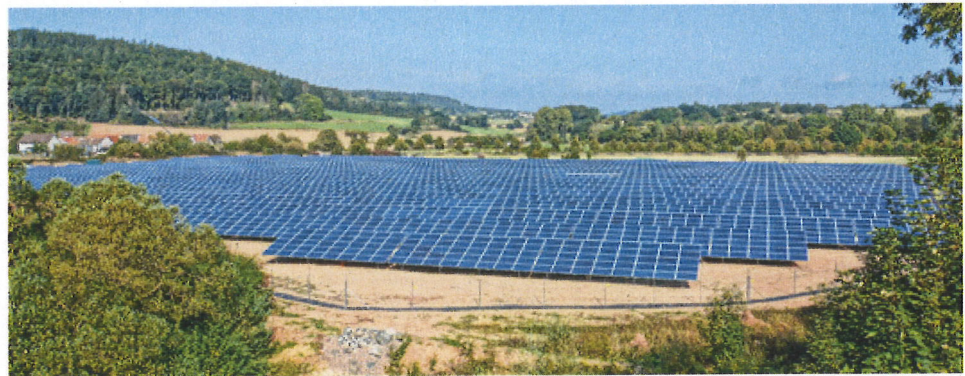
Blick aus südlicher Richtung auf den Solaracker Cölbe.